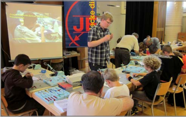
Lötarbeitungsplätze am Jahrestreffen der Funkamateure

Auch dieses Jahr waren wir auswärts vertreten, sowohl beim Rennen der Solarautomobile beim Gallusplatz mit Platz 3 bei 35 Autos als auch beim Jahrestreffen der Funkamateure in Stein AR. Dort betrieben wir einen Bastelcorner mit 10 Arbeitsplätzen.