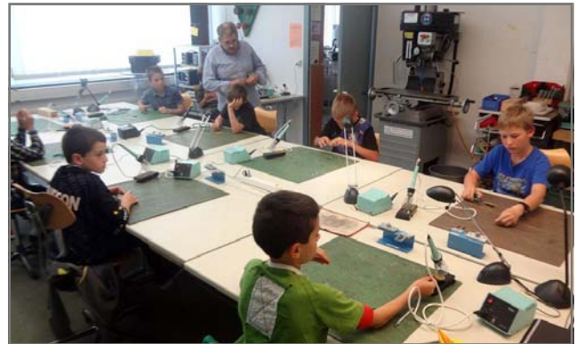
Löten im JEZ: Freiwillige Handarbeit und Ferienstpass St. Gallen

Ganz besonders motiviert mich die erfreuliche Zusammenarbeit mit der Freiwilligen Handarbeit der Stadt St. Gallen . Im Berichtsjahr führten wir den «Bastelkurs Elektronik» bereits an zwei Nachmittagen durch. Es bleibt zu hoffen, dass der eine